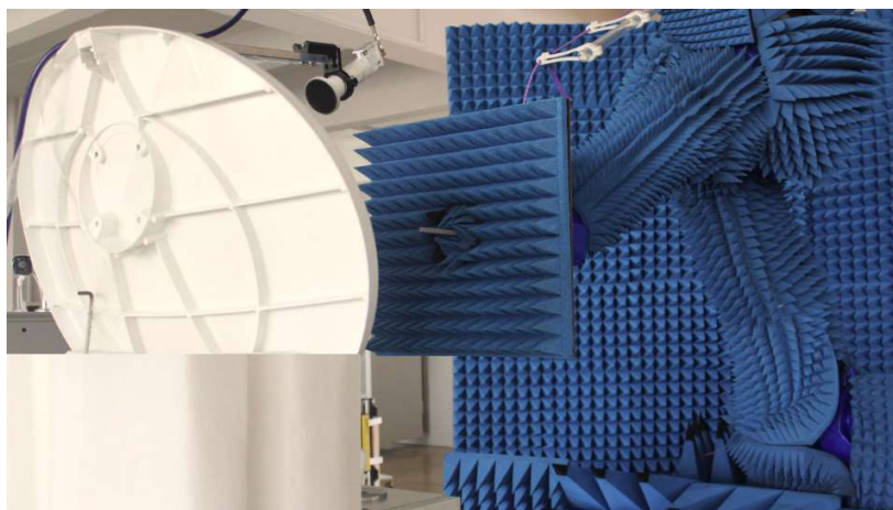
图 1.卫星天线的近场测量设置

为了便于说明，让我们以 Ka 波段卫星天线为例。这是一个窄波束天线，通常进行室内或室外测量。FM81 测试系统的一般测量配置如图 1 所示，这也代表了 FM57 产品设计原理。