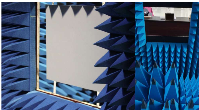
图 3. 使用 FM57 测量行天线罩

拿一些和 FM57 相关应用为例，图 3 是采用 FM57 系统测量雷达罩的通用设置。在我们的实验中，为获取准确的数据，电磁环境、位置距离、角度精度和正确选择的射频元件等都有非常重要的作用。然而适当操控以上项目的自由度既是我们所说的交钥匙测量过程。有时这个过程本身的价值比单个设备的准确性更为重要。