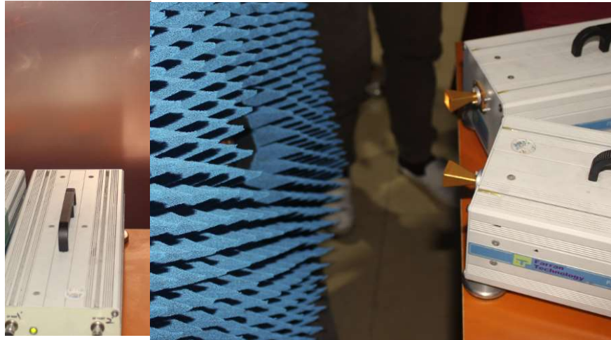
图. 4. 研究吸波材料在 60- 90GHz 的反射特性

总之，本文描述了测量仪器和测量技术的重要性。通过真实卫星天线测量过程，我们得出结论，在特定的情况下，测量技术在整个交钥匙解决方案中可以发挥更加重要的作用